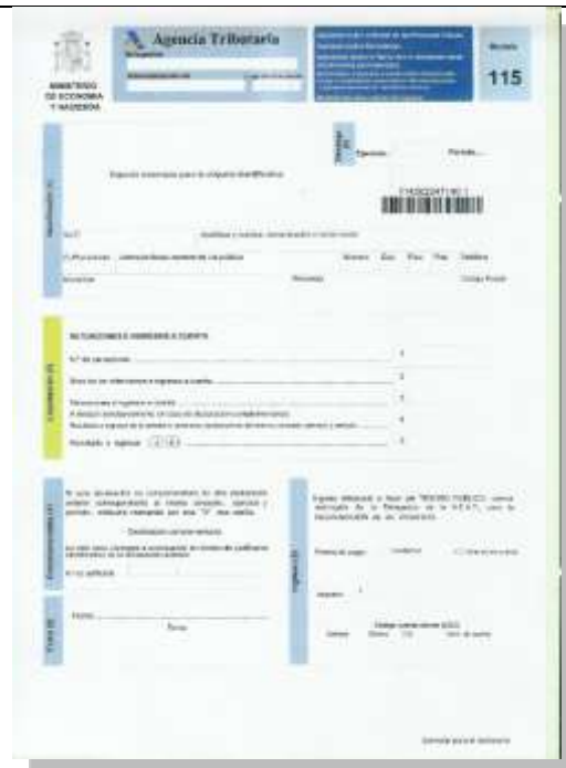
Retenciones e ingresos a cuenta. Rentas o rendimientos procedentes del arrendamiento o subarrendamiento de inmuebles urbanos.

Centro de Enseñanza Informáticas y Empresariales TRON