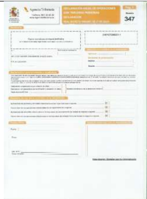
Declaración anual operaciones con terceras personas