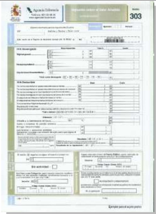
Impuesto sobre el Valor Añadido. Autoliquidación