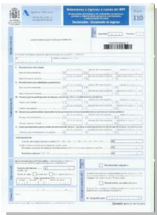
Retenciones e ingresos a cuenta. Rendimientos del trabajo, de actividades profesionales, de actividades agrícolas y ganaderas y premios.