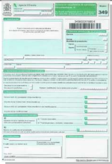
Declaración recapitulativa de operaciones intracomunitarias