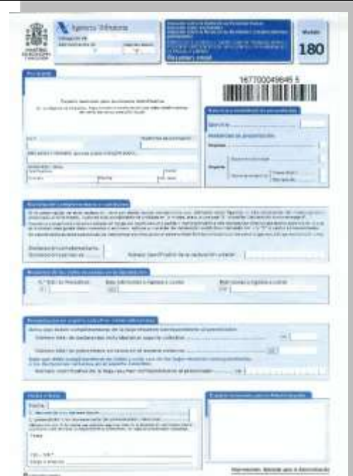
Retenciones e ingresos a cuenta. Rendimientos procedentes del arrendamiento de inmuebles urbanos. Resumen anual.