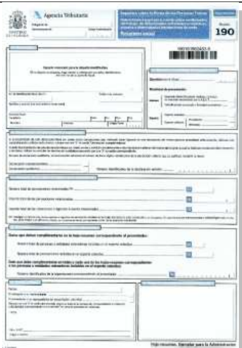
Resumen anual de retenciones e ingresos a cuenta. Rendimientos del trabajo de determinadas actividades