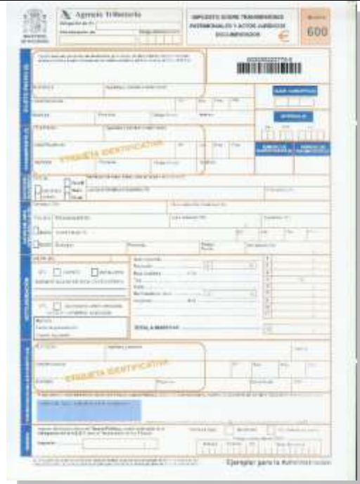
Impuesto sobre Transmisiones Patrimoniales y Actos Jurídicos documentados